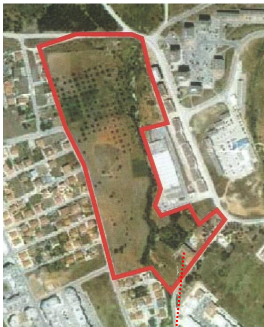
Limites do imóvel