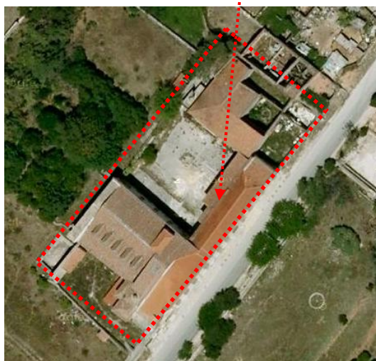
Fotografia aérea - área edificada

O imóvel designado por “Sanatório da Flamengo” é composto por um terreno com uma área de cerca de 77.903,00 m 2 .