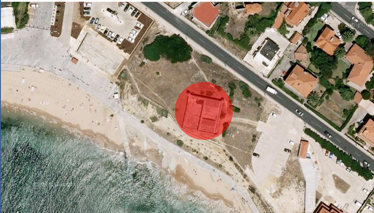
Fotografia aérea com localização do imóvel

A zona envolvente encontra-se completamente infraestruturada e é bem servida de transportes públicos usufruindo, ainda, da proximidade da Estrada Marginal de Cascais, que se constitui como um importante eixo viário de acesso a Lisboa.